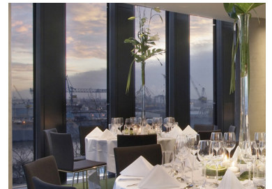
„Conference 3C + 3D“